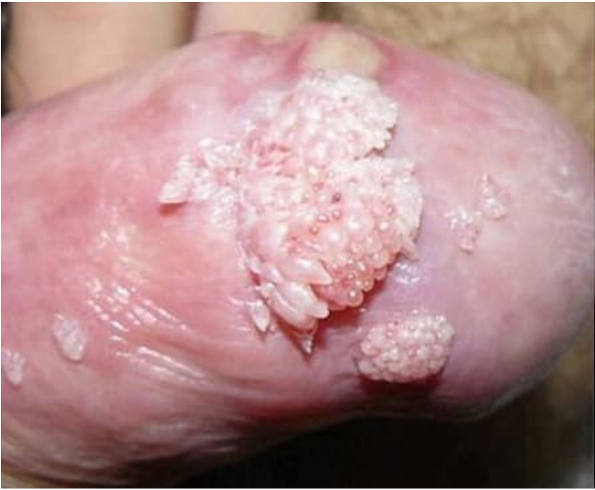
Hình ảnh bệnh sùi mào gà tại rãnh lớp da bọc dương vật