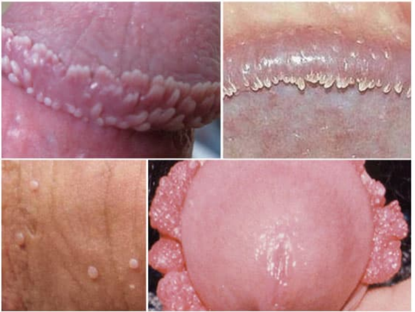
Hình ảnh bệnh sùi mào gà tại rãnh bao quy đầu